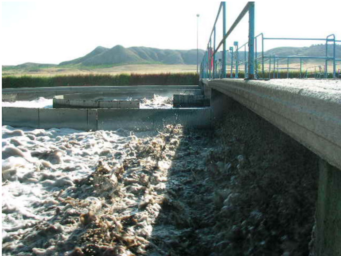
(foto19 – carrusel biológico “canal de aireación”)

La elevada edad del fango a la que opera el reactor biológico (12 – 14 días) permite en esta etapa alcanzar un rendimiento de eliminación de nitrógeno cercano al 50% y una reducción total de proceso del 60%.