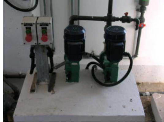
(foto12 – dosificación de floculante a F-Q)

El cloruro férrico se almacena en un depósito vertical cilíndrico de 15 m 3 y se dosifica mediante dos bombas que operan entre los 0 – 130 l/h.