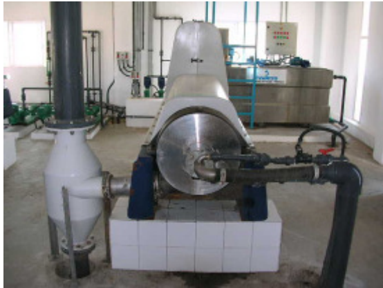
(foto23 – centrífuga “B”)

Para optimizar el proceso de secado se adiciona al fango en su entrada a la centrífuga un polielectrolito catiónico. El fango deshidratado sale de la centrífuga por su parte inferior y se deposita en contenedores de 4,3 m 3 para su posterior evacuación. El clarificado se retorna a cabecera de planta. Ambas centrífugas se encuentran conectadas al sistema de tratamiento de gases para evitar malos olores.