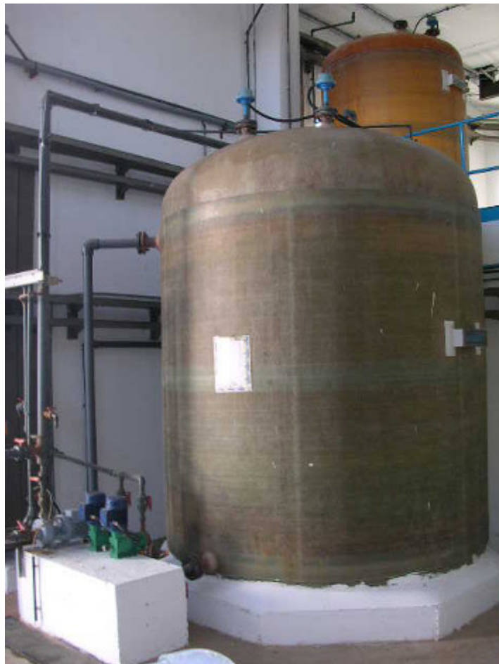
(foto10 – almacenamiento y dosificación del coagulante)

El cloruro férrico se almacena en un depósito vertical cilíndrico de 15 m 3 y se dosifica mediante dos bombas que operan entre los 0 – 130 l/h.