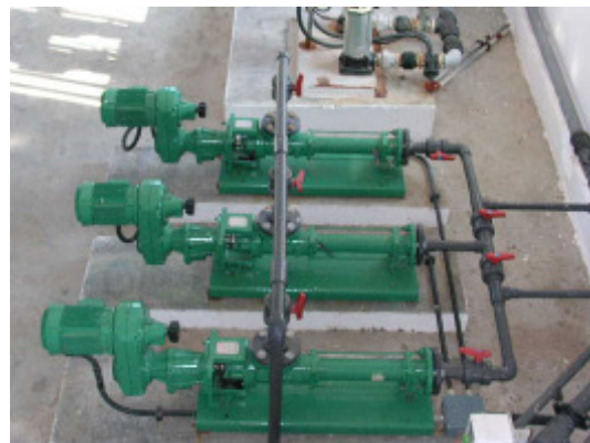
(foto26 – sistema de dosificación de polielectrolito a centrífugas)