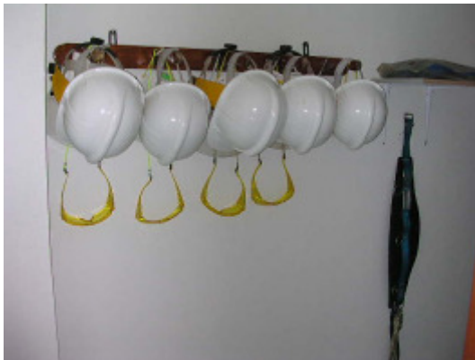
(foto31 – zona de acopio de EPI'S)