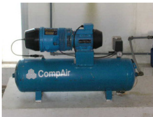
(foto29 – compresor de aire)