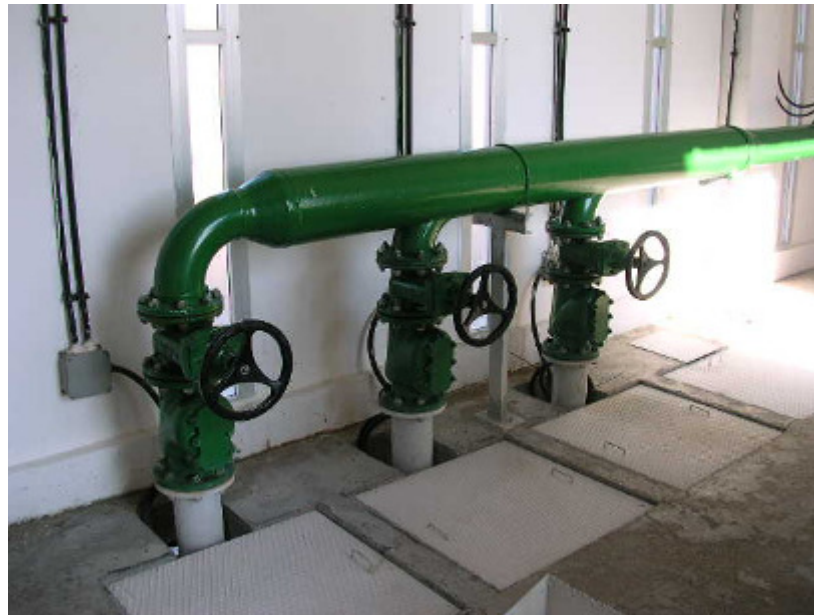
(foto13 – sistema de impulsión de agua bruta)

Un juego de llaves permite enviar el agua bombeada directamente al decantador primario en aquellos casos en los que no se desee utilizar el lecho.