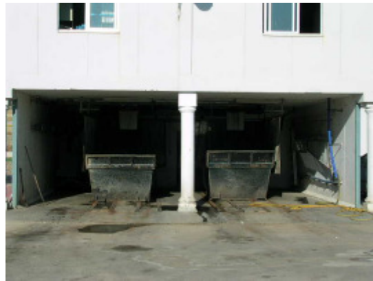
(foto24 – contenedores de recogida de fangos deshidratados)

La impulsión de los fangos espesados se realiza mediante bombas de tornillo excéntrico. Se dispone de tres bombas de impulsión de fangos de las cuales dos permanecen activas y una en reserva. Para la preparación de polielectrolito se dispone de un equipo de preparación automático en continuo de 1.000 litros de capacidad útil. La dosificación se realiza mediante tres bombas de tornillo excéntrico de las cuales dos permanecen activas y una en reserva.