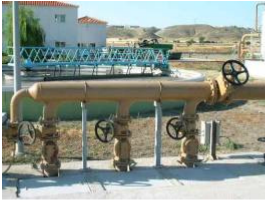
(foto17 – recirculación de fangos a biológico)