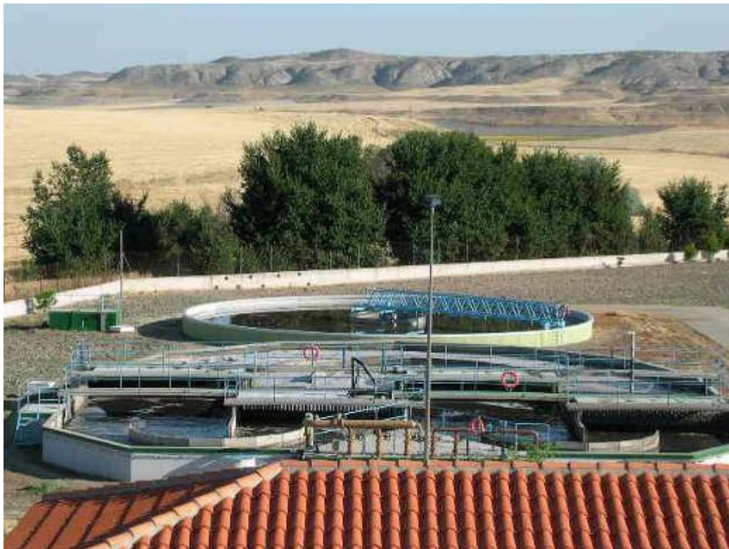
(foto16 – segunda etapa de tratamiento biológico: “carrusel biológico y decantación secundaria”)

El aporte de oxígeno se ejerce mediante cuatro rotores de aireación superficiales movidos por motores de 37 Kw. Para mantener una velocidad de flujo en el interior del reactor de 0,3 m/s e impedir de este modo sedimentaciones se ha dotado al reactor de dos aceleradores de flujo de 4 Kw.