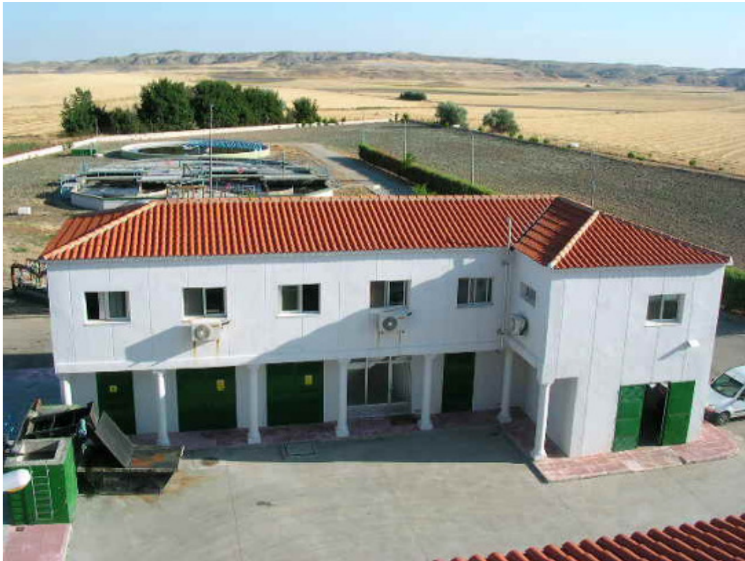
(foto30 – edificio de control)