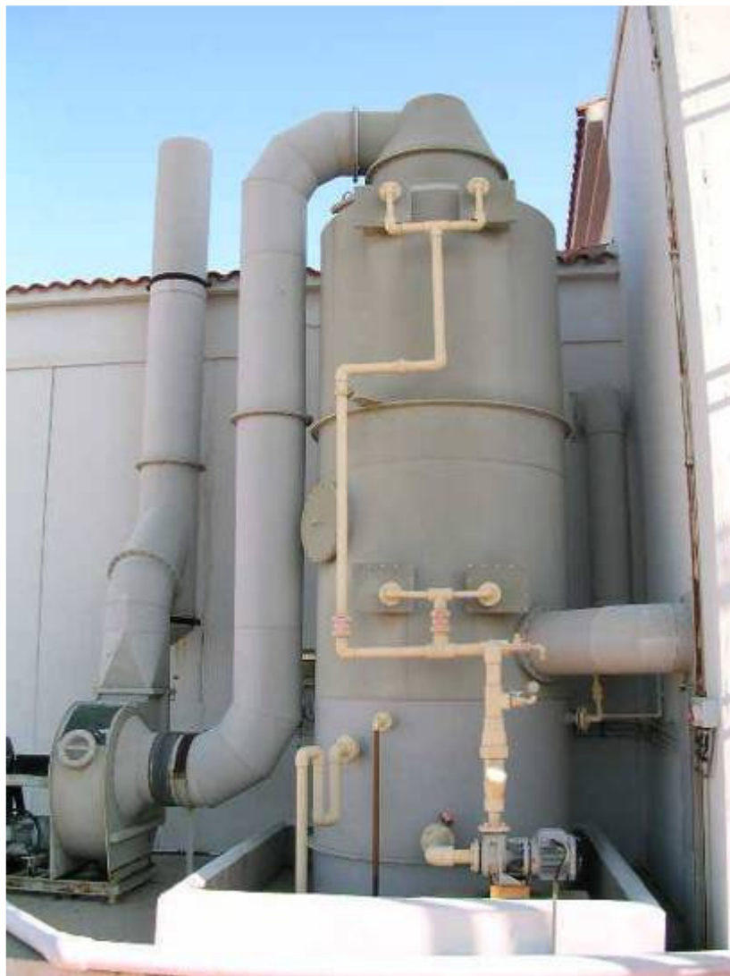
(foto27 – torre de lavado de gases)

Para el tratamiento de los gases producidos se ha diseñado una línea de desodorización compuesta de un extractor de aire, una torre de lavado de gases y un sistema de conducción de gases al que se encuentran conectados el edificio de pretratamiento, el edificio de deshidratación, las centrifugas y el espesador. Como reactivo de tratamiento se utiliza hipoclorito que se encuentra almacenado en un depósito cilíndrico vertical dentro del edificio de deshidratación. La eficacia del proceso de desodorización se controla mediante una sonda de medición de potencial redox.