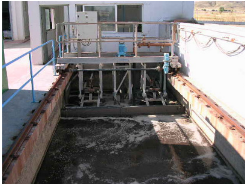
(foto4 – desarenador - desengrasador)

A la salida del desarenador existe una cámara donde se sitúa un caudalímetro ultrasónico para la medida del caudal de entrada a planta. Este caudalímetro ofrece dos lecturas; totalizador y caudal instantáneo expresado en \text{m}^3/\text{h} .