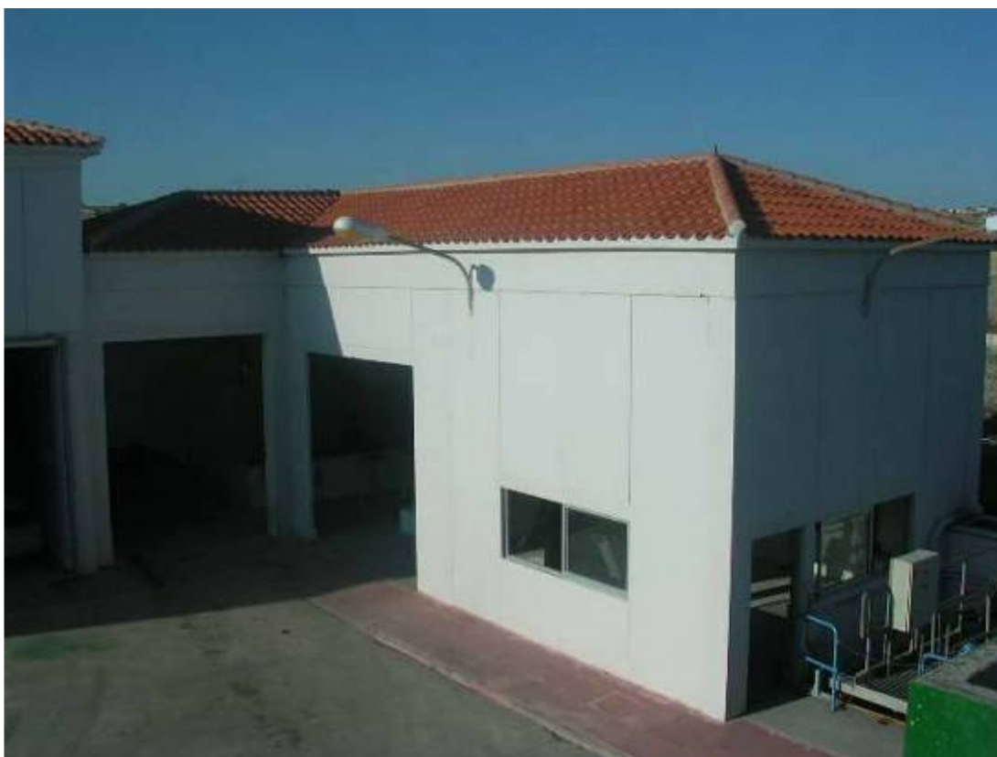
(foto35 – edificio de pretratamiento)

Este edificio se encuentra conectado a la línea de tratamiento de olores.