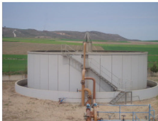
(foto14a y foto14b – 1ª etapa de tratamiento biológico “lecho bacteriano”)