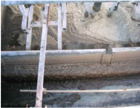
(foto5 – recogida de grasas y flotantes)

Las grasas, una vez depositadas en el punto de recogida, pasan a la arqueta de acumulación para posteriormente ser elevadas a un desnatador de paletas de doble eje desde son expulsadas a un contenedor.