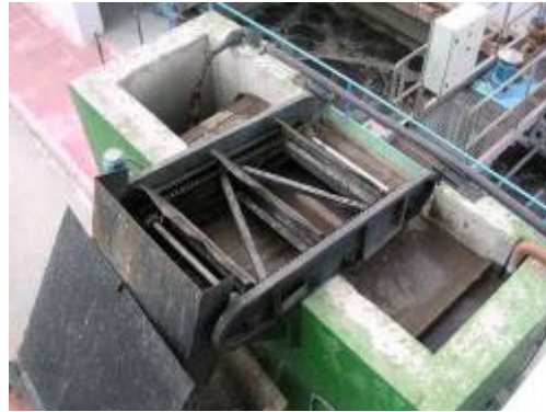
(foto6 – desnatador de paletas)

Las arenas extraídas se envían a un equipo separador de arenas, tipo vaivén, que las deposita en un contenedor.