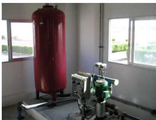
(foto28 – sistema de bombeo de agua a presión)