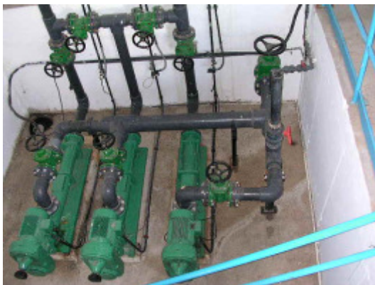
(foto25 – sistema de impulsión de fangos a centrífugas)

La impulsión de los fangos espesados se realiza mediante bombas de tornillo excéntrico. Se dispone de tres bombas de impulsión de fangos de las cuales dos permanecen activas y una en reserva. Para la preparación de polielectrolito se dispone de un equipo de preparación automático en continuo de 1.000 litros de capacidad útil. La dosificación se realiza mediante tres bombas de tornillo excéntrico de las cuales dos permanecen activas y una en reserva.