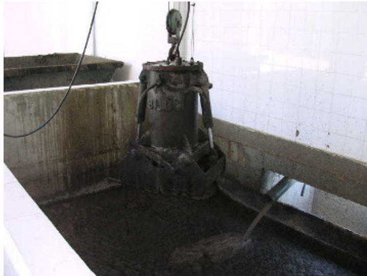
(foto1 – pozo de gruesos)