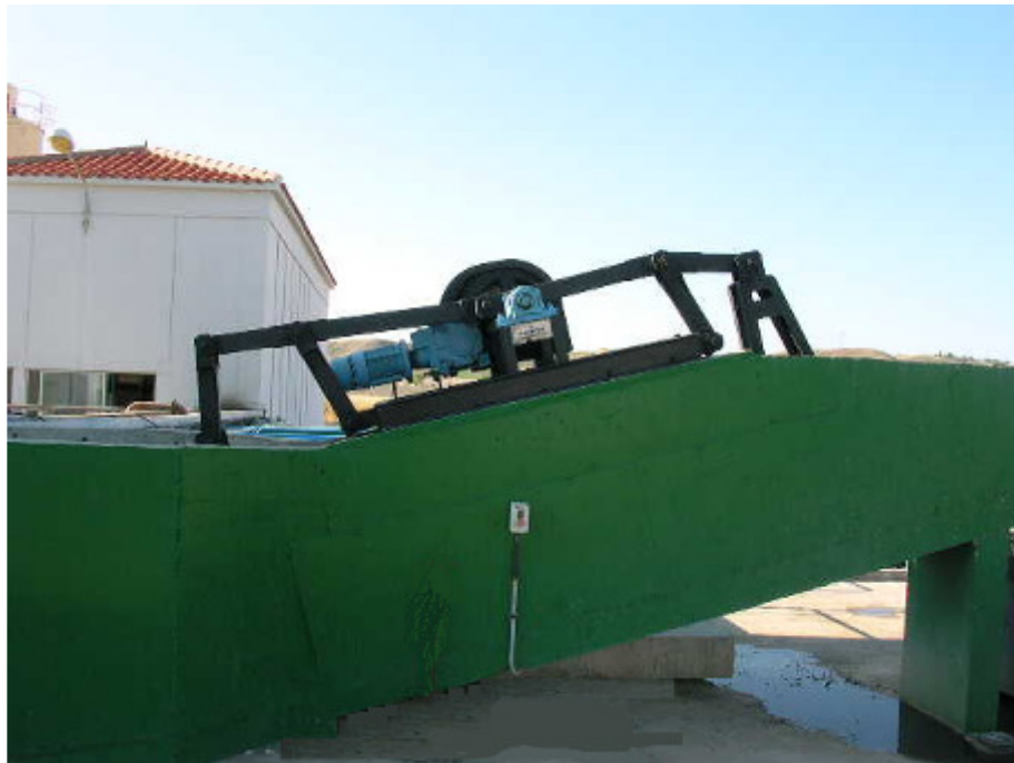
(foto7 – clasificador de arenas)

Las arenas extraídas se envían a un equipo separador de arenas, tipo vaivén, que las deposita en un contenedor.