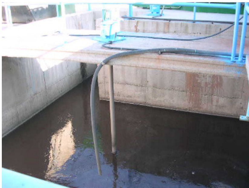
(foto8 – físico-químico; “cámara de floculación”)

La agitación lenta en esta cámara se realiza con dos agitadores de paletas accionados por motores de 0,18 Kw.