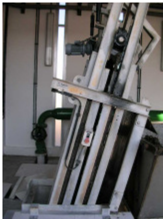
(foto2 – reja de gruesos)

Se dispone de 1 canal de desbaste más otro de by-pass que entra en servicio cuando se llevan a cabo tareas de mantenimiento en el canal principal. El caudal máximo de diseño de estos canales es de 880 m 3 /h. El desbaste de gruesos se realiza mediante una reja automática de 30mm de paso y el de finos con un tamiz continuo autolimpiante de 6mm de paso. En el canal de by-pass se encuentra instalada una reja manual de 30mm de paso. Los sólidos retirados por las rejillas se depositan en contenedores colocados bajo las rejillas.