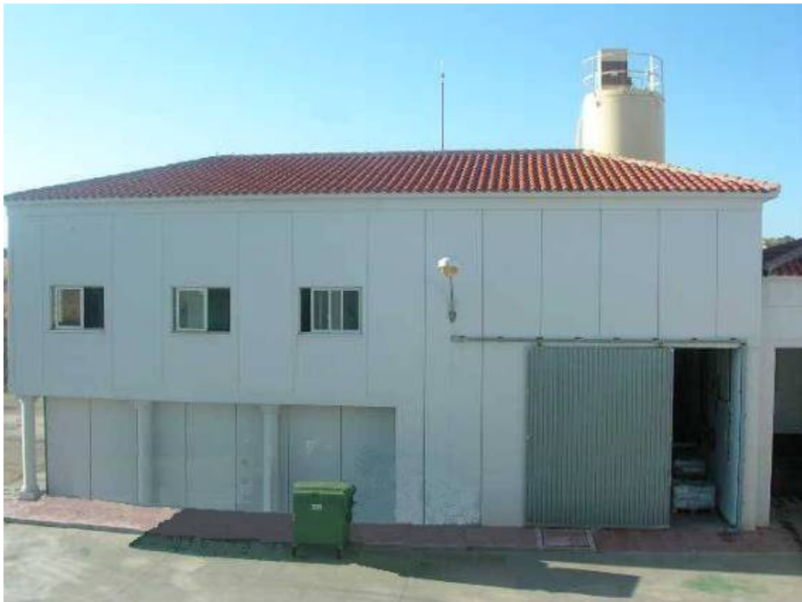
(foto36 – edificio de deshidratación)

Este edificio se encuentra conectado a la línea de tratamiento de olores.