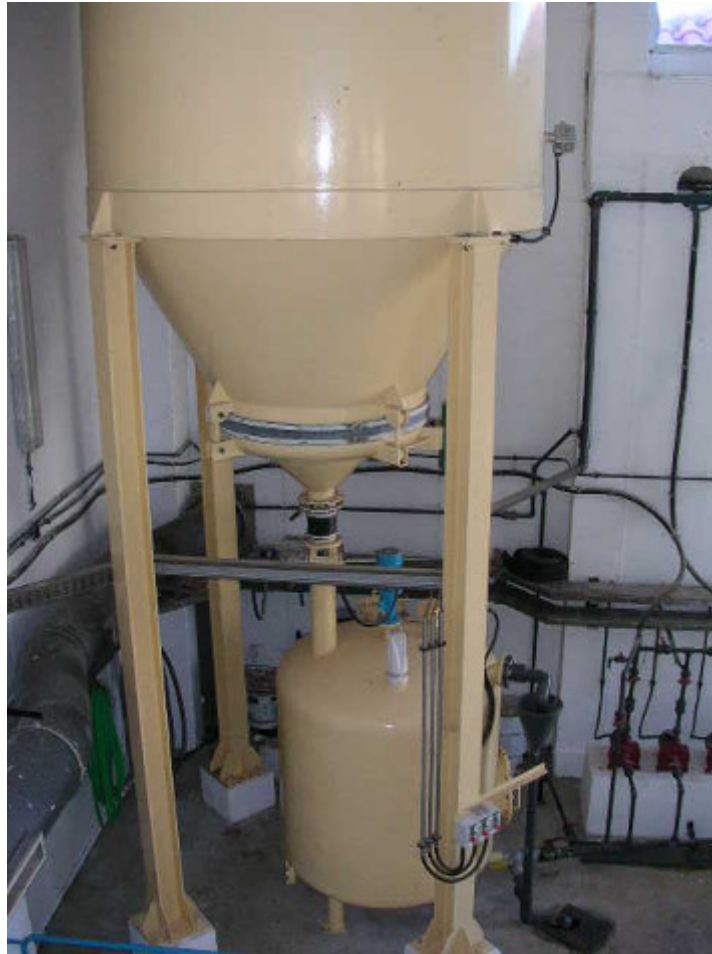
(foto9 – almacenamiento, preparación y dosificación de lechada de cal)

La cal se almacena en un silo cilíndrico de 30 m 3 de capacidad provisto de un extractor vibrante. La lechada de cal se prepara mediante adición de agua en una cuba de preparación de 2 m 3 de capacidad y se dosifica mediante 2 bombas de 7 m 3 /h de caudal nominal.