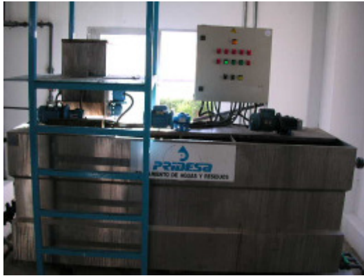
(foto11 – preparación de floculante)