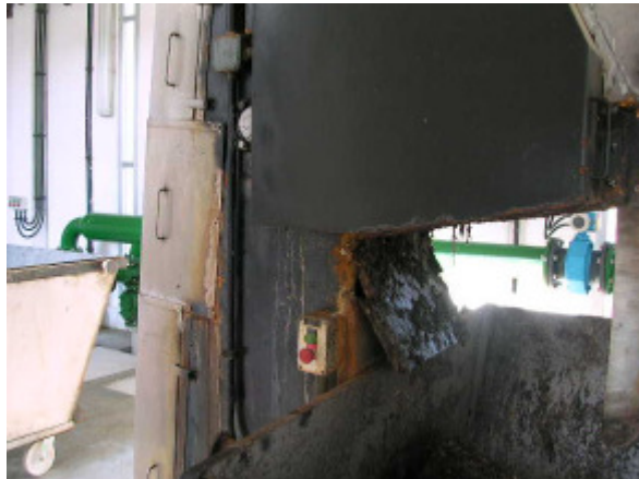
(foto3 – tamiz de finos)