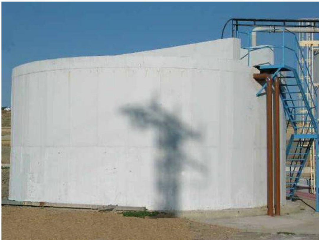
(foto22 – espesador de fangos)