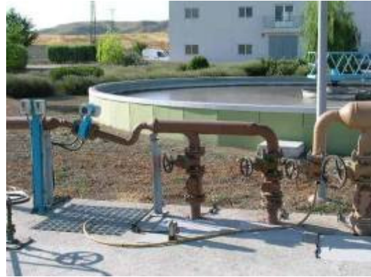
(foto18 – sistema de bombeo de fangos en exceso a espesador)

La elevada edad del fango a la que opera el reactor biológico (12 – 14 días) permite en esta etapa alcanzar un rendimiento de eliminación de nitrógeno cercano al 50% y una reducción total de proceso del 60%.