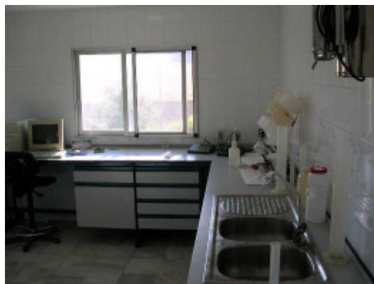
(foto34 – laboratorio)