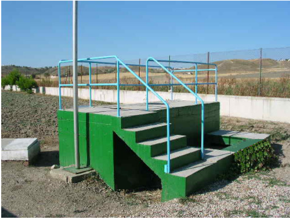
(foto21 – fuente de presentación)

El efluente tratado se vierte directamente a cauce público mediante un emisario superficial que conecta la fuente de presentación con el cauce del Arroyo Salado. En la fuente de presentación se encuentra instalado el caudalímetro ultrasónico de salida. Este caudalímetro ofrece dos lecturas; totalizador y caudal instantáneo expresado en \text{m}^3/\text{h} .