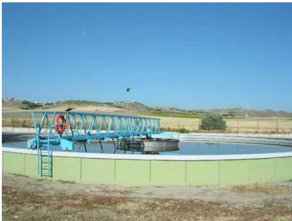
(foto20 – decantador de segunda etapa)