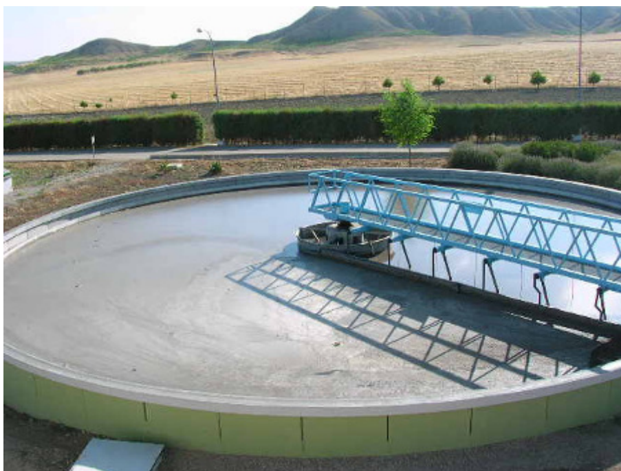
(foto15 – decantación primaria)

Para el proceso de segunda etapa se proyecta un reactor biológico tipo carrusel de una línea de tratamiento aireado mediante cuatro rotores superficiales horizontales. El reactor biológico se encuentra dividido en dos zonas: zona óxica y zona anóxica. El control de la cantidad de oxígeno disuelto en cada una de estas zonas se realiza mediante dos sondas de medición de oxígeno que pueden expresar el resultado en mg/l o en % de saturación.